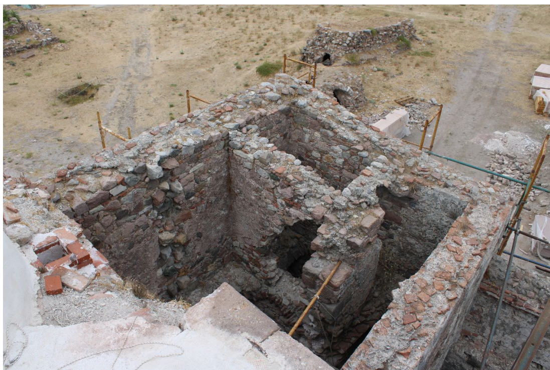
Εικ. 9 Το βόρειο τμήμα του κτηρίου όπου θα ανακατασκευαστεί μονοκλινής ξύλινη στέγη.