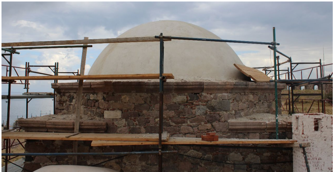
Εικ. 1, 2 Απόψεις της υφιστάμενης κατάστασης του τρούλου της αίθουσας προσευχής