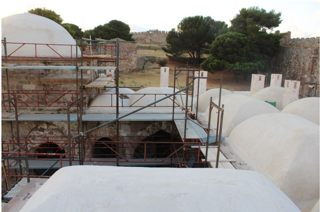
Εικ. 3 Γενική άποψη της υφιστάμενης κατάστασης της θολοδομίας του κτηρίου, μετά την ολοκλήρωση των εργασιών εξυγίανσης των εξωραχίων. Άποψη από τα ΒΔ.