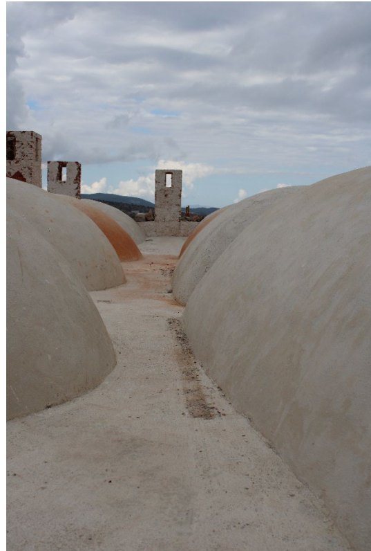
Εικ. 5, 6 Απόψεις του τμήματος μεταξύ των εξωραχίων στοάς και δωματίων στον όροφο (ΝΔ πτέρυγα). Κατά μήκος του τμήματος αυτού θα διαμορφωθεί κτιστός αγωγός μέσω του οποίου τα όμβρια ύδατα θα διοχετεύονται στις τέσσερις ισχυρά προέχουσες λαξευτές υδρορρόες που βρίσκονται κάτω από το γείσο, προς την αυλή του κτηρίου.