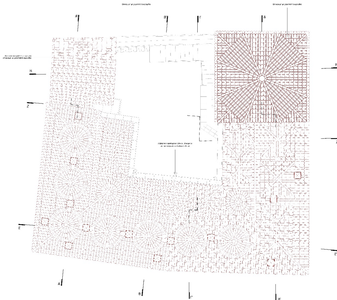
Ενδεικτικό σχέδιο κεράμωσης στέγης και θόλων.