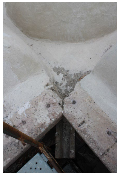
Εικ. 7, 8 Απόψεις προέχουσας λαξευτής υδρορρόης που βρίσκεται κάτω από το γείσο.