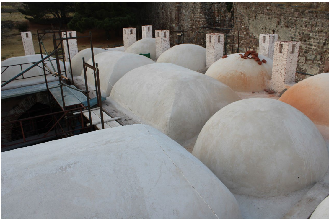
Εικ. 4 Γενική άποψη της υφιστάμενης κατάστασης της θολοδομίας του κτηρίου, μετά την ολοκλήρωση των εργασιών εξυγίανσης των εξωραχίων. Άποψη από τα βόρεια.